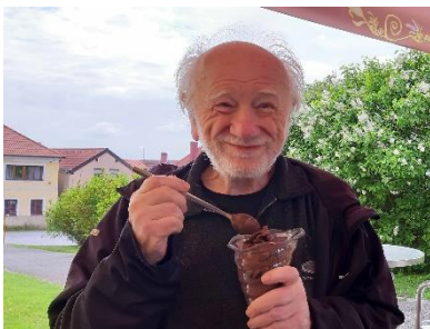
Návštěva Mníšku zahájena zmrzlinou