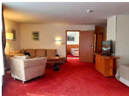
Naše apartmá v Ostrově