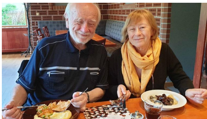
Příjemné posezení u večeře, i když venku pršelo