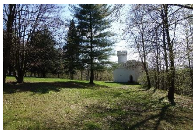
Janův hrad ve vlašimském parku