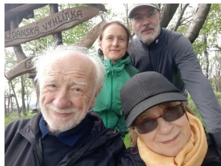
Na úbočí Děčínského Sněžníku