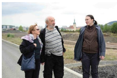
Zde býval královský Most