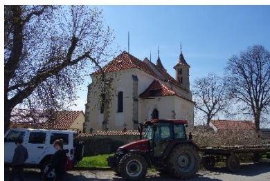
Kondrac, románský kostel

Z Louňovic jsme vyrazili se zastávkou u zajímavého románského kostela v Kondraci do Vlašimi , města, kde jsem prožíval dva učňovské roky a na které mám hodně různých vzpomínek. Podívali jsme se k továrně Sellier & Bellot, při procházce parkem jsem Evince a Hlinkům ukázal internát a školu 5 ; u té jsme se však před odjezdem ještě stavili, když jsme se jeli podívat na Domašínskou bránu. Před tím jsme ovšem strávili příjemnou větší chvíli ve velké cukrárně na severní straně Žižkova náměstí.