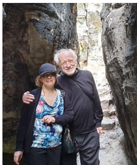
V Tiských stěnách