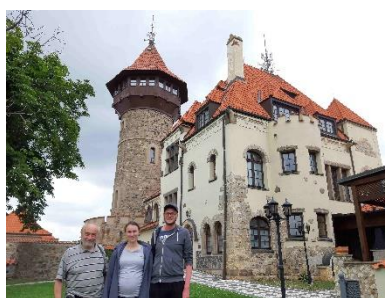
S Junovými na hněvinském nádvoří