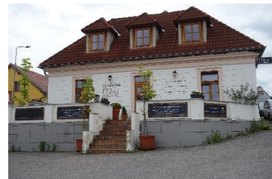
Kavárna Malý mnich (= Mníšek)

Mníškem jsme se prošli, mj. jsme obešli zámek a při tom měli hezký výhled na rybník, dobře se v restauraci U Benáků naobědvali, v kavárně Malý mnich popili dobrou kávu, v cukrárně-pekárně u kostela se osvěžili při příjezdu i před odjezdem, a hlavně jsme čas prožili spokojeni a ve výborné pohodě.