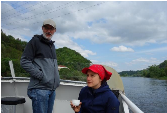
Na lodi nám bylo dobře