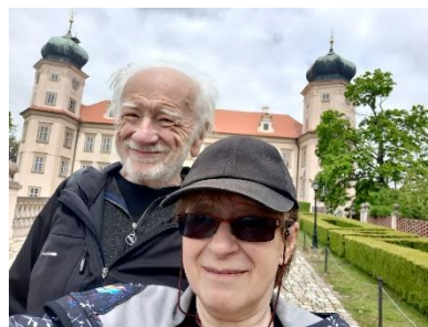
Spolu před zámkem