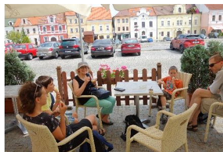
Posezení v Kadani