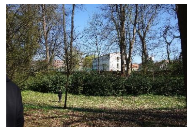
Bývalý internát z parku