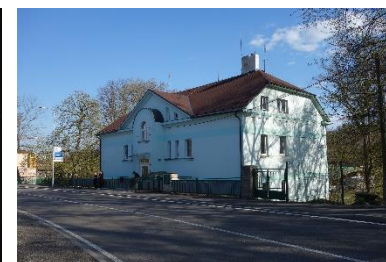
Bývalá učňovská škola