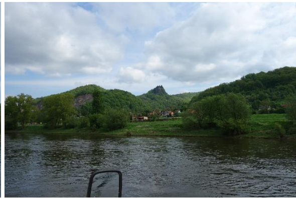
Rádi jsme viděli kopec se zříceninou hradu Vrabinec