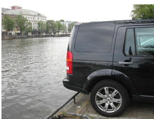
Amsterdam je město grachtů

Amsterdam je doslova protkán grachty. Čecha zarazí, že u nich není zábradlí. Ono by narušovalo typický charakter města. Pády aut do grachtů a jejich vytahování prý patří k tamnímu životu. Od jihu