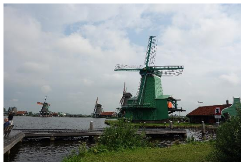
Zaandam: Větrné "mlýny"