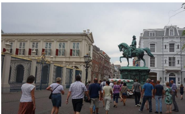
Před královským palácem