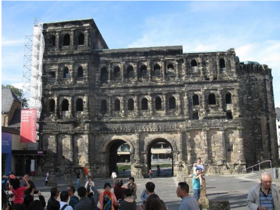
Trevír, Porta Nigra

V Trevíru nás autobus dovezl k monumentální Černé bráně (Porta Nigra), jíž se od severu či severovýchodu vchází do historického města. Odtud jsme šli příjemnou