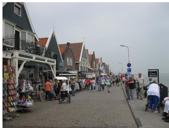
Volendam inspiruje k procházkám