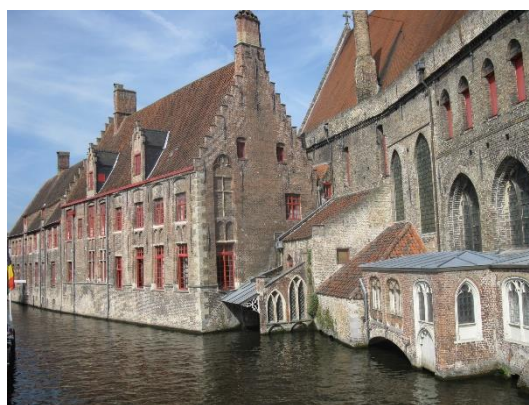
Bruggy – Benátky severu

K tomuto zájezdu patřily celkem tři projížďky lodí; kromě Brugg to byl ještě rotterdamský přístav a síť grachtů v Amsterdamu. V Bruggách jsme ovšem při ní byli nejvíce ve městě; od domů nás většinou neoddělovalo ani žádné nábřeží – prostě Benátky severu.