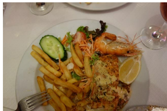
Večeře v Bruselu