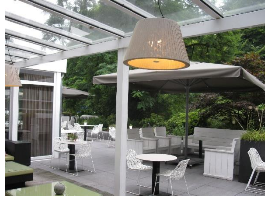
Hotel Fletcher na okraji Amersfoortu