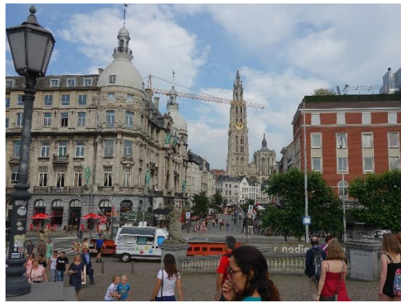
Pohled z nábřeží ke katedrále