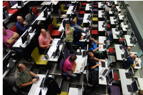
Aalsmeer, největší květinová burza na světě

V pátek ráno jsme jeli nejdříve do Aalsmeeru , který je jižním amsterdamským předměstím. Cestou jsme jeli kolem města Hilversum, které jsem znal z dob dětství a mládí ze stupnic rozhlasových přijímačů; býval tam významný vysílač, už ani nevím, zda středovlnný či dlouhovlnný. Aalsmeer je centrem obchodu s květinami. Obchodní halu jsme prošli, viděli jsme jak manipulaci s květinami, tak srdce obchodu – burzovní místnost, kde seděli – převážně muži – s počítači; někteří zřejmě bedlivě sledovali vývoj cen a reagovali na něj, jiní pospávali