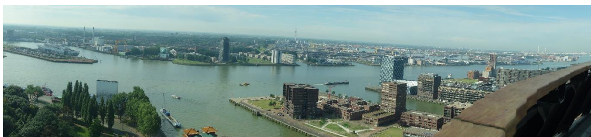
Pohled z Euromastu

Euromast je věž v Rotterdamu postavená v letech 1958–1960 architektem H. A. Maaskantem. ■ Byla postavena speciálně pro Floriádu (výstavní akce floristů, květinářů a zahradníků) 1960. Jde o betonovou stavbu o průměru 9 m a o tloušťce stěny 30 cm. Za účelem stability byla postavena na betonovém bloku o hmotnosti 1 900 000 kg, čímž bylo těžiště stavby přesunuto pod zem. ■ Ve výšce 96 metrů je umístěna vyhlídková terasa a restaurace. Se svou původní výškou 101 metrů byla Euromast nejvyšší stavbou v Rotterdamu. V roce 1970 byla na vrchol přidána 85 metrů vysoká nástavba, čímž se opět stala nejvyšší stavbou města.