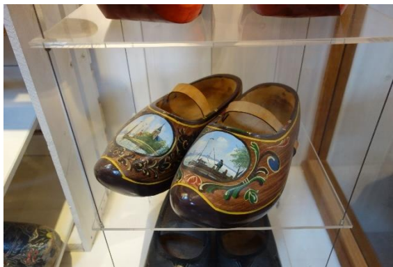
Pečlivá výroba dřeváků se promítne do elegantnosti výrobků