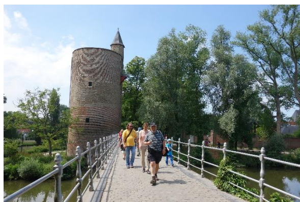
Věž mezi Dvorem bekyní a parkovištěm