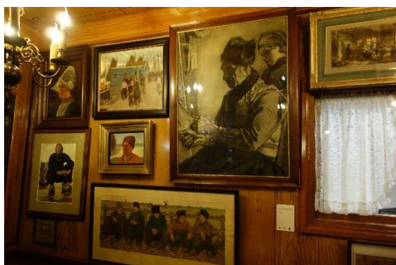
Návštěva restaurace byla uměleckým zážitkem