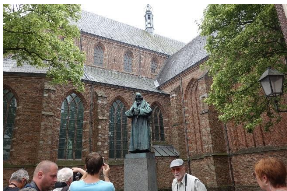
Makovského socha mimo areál památníku

Komenského hrob je v něm. Památník je součástí komplexu františkánského kláštera a patří k němu i klášterní zahrada.