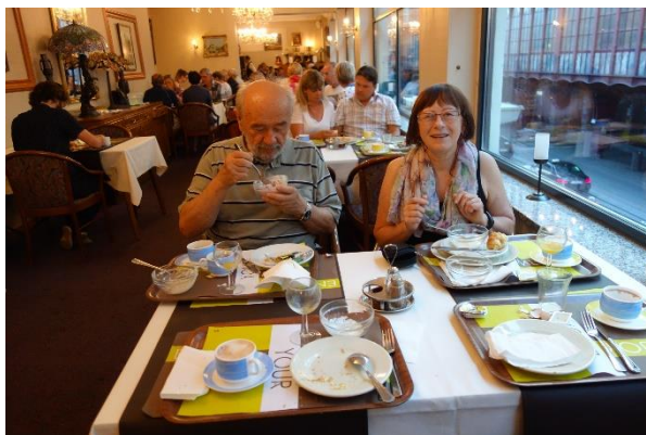
Večeře v hotelu Century

V roce 1989 bylo centrální nádraží v Antverpách klasické městské hlavové nádraží s kolejištěm v úrovni 1. patra. Budova byla včele na severní straně nádraží a všechny vlaky odjížděly k jihu. Vnější vzhled se od té doby nijak nezměnil, leč střední část kolejiště v poschodí zmizela a nahradila je jakási galerie, odkud byl pohled do nově vzniklé podzemní části s asi dvěma průjezdnými severojižními kolejemi. Počet nástupišť se asi zmenšil, kvůli podzemním nástupištím zmizelo asi více těch nadzemních, avšak možnost bezúvratového projíždění umožňuje dopravu zrychlit. Při současných krátkých intervalech mezi vlaky se dlouhé pobyty ve stanicích kvůli čekání na přípoje stávají zbytečnými, a tedy se vystačí s menším počtem nástupišť.