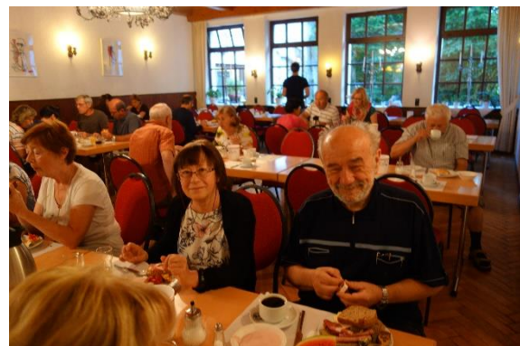
Mlýnské kolo pod naším balkónem ← Karlsmühle → Snídaně