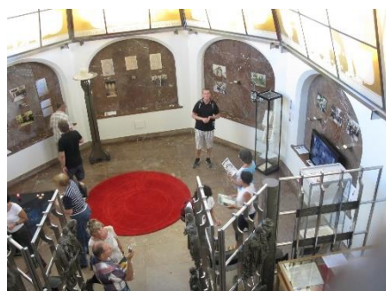
V Komenského památníku