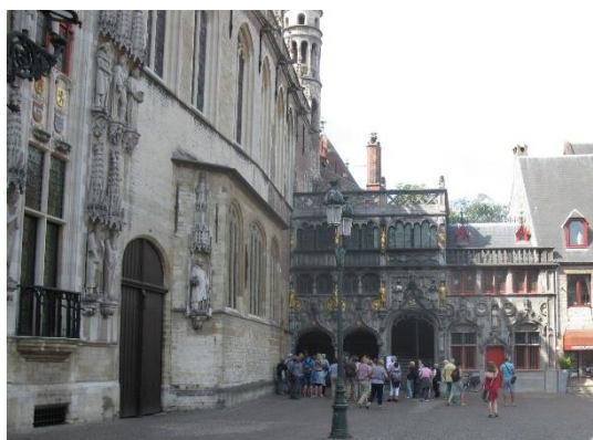
Bazilika Svaté krve

K tomuto zájezdu patřily celkem tři projížďky lodí; kromě Brugg to byl ještě rotterdamský přístav a síť grachtů v Amsterdamu. V Bruggách jsme ovšem při ní byli nejvíce ve městě; od domů nás většinou neoddělovalo ani žádné nábřeží – prostě Benátky severu.