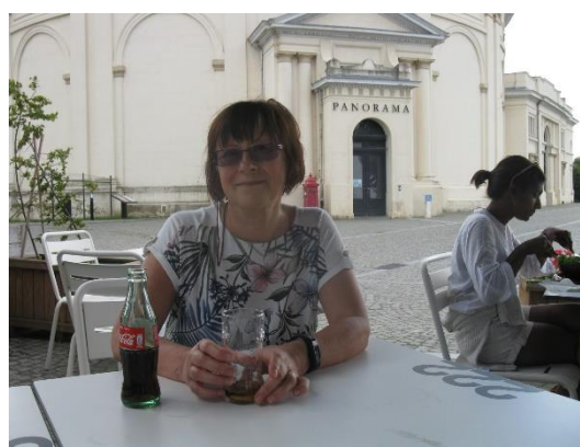
Památník a Lví pahorek ← Waterloo → Příjemné občerstvení

A tak jsem byl rád, když už jsme Waterloo opustili a zamířili do Bruselu , města, které mně, na rozdíl od Evinky, bylo zcela neznámé. Podobně jako v Lucemburku i zde jsme viděli moderní čtvrt' vybudovanou pro evropské instituce; vždyť Brusel se někdy považuje za "hlavní město Evropy". Viděli jsme královský zámek, strávili jsme nějakou dobu na Velkém náměstí (na něm je i monumentální radnice) a jeho okolí, prošli jsme zajímavou obchodní pasáží. Příjemné bylo, že večeri jsme měli v centru Bruselu v restauraci Malý Brusel (Le Petit Bruxelles) ; dokonce nám byl nabídnut výběr z dvou jídel, který jsme pochopili. A po večeri jsme se ještě absolvovali hezkou procházkou Bruselem. Mně samozřejmě bylo líto, že jsme nenavštívili žádné bruselské nádraží, ale to už přijímám jako danou stinnou stránku zájezdů. 1 Víím, že ta nejdůležitější bruselská jsou podzemní a tuším, že nedaleko jednoho jsme po večeri šli.