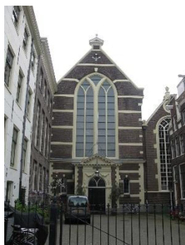
Vallonský evang. kostel

o srazu nedostala. Když byl v okolí sv. Mikuláše náhodně potkán, spadl nám všem kámen ze srdce.