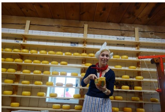
Interiéry ve skansenu zdobí nejen pečlivě vyrobené dřeváky, nýbrž i pečlivě vyrobený sýr

Po prohlídce zaandamského skansenu jsme zajeli na naši poslední zastávku – do Amsterdamu . Zatímco my jsme si prohlíželi grachty protkanou metropoli, řidiči měli nutný odpočinek před dlouhým přejezdem do Prahy a Brna. V Amsterdamu jsme vystoupili v centru na nábřeží Singelgrachtu před budovou pivovaru Heineken s tím, že údaje o odjezdu dostaneme při odpolední společné projížďce lodí po grachttech.