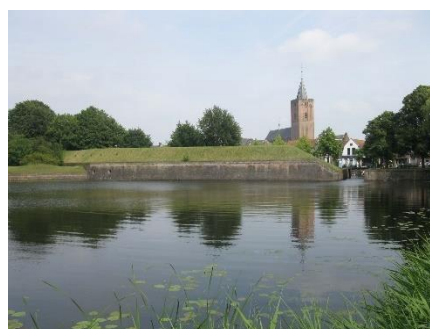
Pevnostní město Naarden

Z Naardenu jsme odjeli do Amersfoortu na večeri a poslední nocleh na tomto zájezdu. Na ten pak navázala poslední snídaně s oblíbeným švédským stolem a odjezd do Amsterdamu či vlastně nejdříve do skansenu holandské vesnice Zaanse Schans v jeho severním předměstí Zaandamu . Zde jsme si připomněli, že kromě sýrů k Holandsku patří větrné "mlýny", ovšem nikoli na mletí obilí, nýbrž k odčerpávání vody. A určitou místní specialitou je výroba dřeváků.