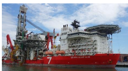
Z projíždky přístavem