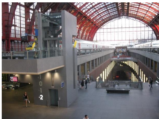
Interiér nádraží v Antverpách

komplikované, s navigací při tom pomohl i nějaký místní občan. K nádraží jsme nakonec šťastně dojeli, autobus zastavil u vysokého hotelu v úzké ulici na západní straně nádraží, rychle jsme si vyzvedli zavazadla (autobus dost překážel v provozu), ubytovali se v pokoji s výhledem na horní část nádražní klenby, příjemně se navečeřeli, prohlédli si nádraží s okolím a přitom zavzpomínali na dramatickou cestu z Delftu do Oostende v roce 1989, a pak se příjemně vyspali před cestou do poslední z cílových zemí Beneluxu, do Nizozemí.