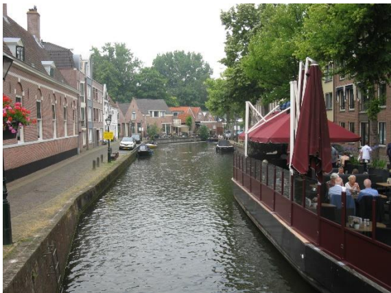
Voda patří k holandským městům

Kromě květin se s Nizozemím spojují sýry. Oprávněně. Připomínají to nejen značky Eidam, Gouda, Maasdamer, ale i folklorní nabídky sýrů, s nimiž jsme se v Severním Holandsku setkali. A v městě Alkmaar (historické město ze 13. století, dnes má něco přes 100 tisíc obyvatel) jsme dokonce viděli jakousi městskou slavnost sýrů 8 . Sýry byly vyloženy na náměstí, sýry se nosily na speciálních nosítkách (a dokonce nosiči s nimi i běhali), a samozřejmě, sýry se prodávaly. Během individuální procházky Alkmaarem jsme si zašli do kostela na kávu; je to takové sympatické řešení: kostel pro návštěvníky nejen otevřený, nýbrž i pohostinný. Samozřejmě jde o kostel protestantský.