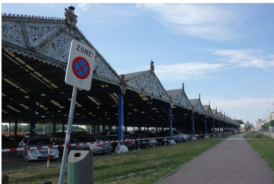
Tržnice přeměněná v parkoviště