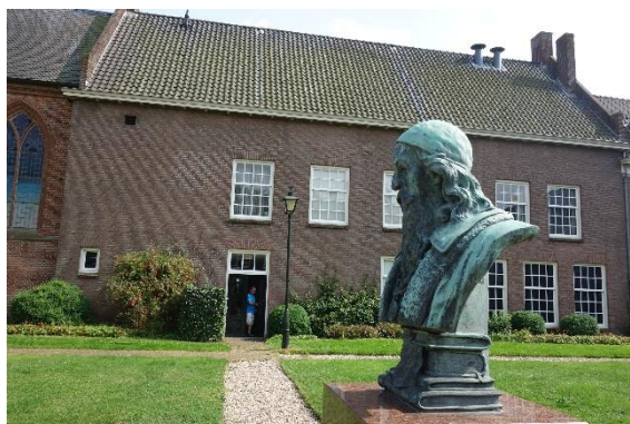
Na zahradě areálu památníku Ko