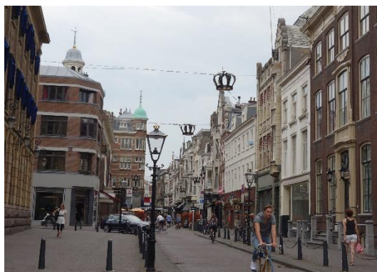
Korunky nad ulicí