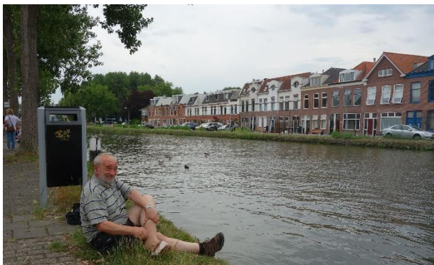
U grachtu před porcelánkou