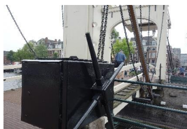
Magere Brug z lodi (2x) i z pevniny (1x)

Nejzajímavějším zážitkem z naší individuální prohlídky Amsterdamu byla návštěva tajného katolického kostela či kaple Náš Pán v podkroví .