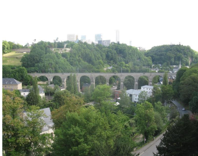
Mosty jsou ozdobou Lucemburku

Jiné místo jsme už v lucemburském velkovévodství nenavštívili; naším dalším cílem bylo Waterloo , místo drtivé Napoleonovy porážky z roku 1815.