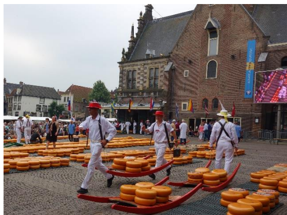
Sýry na náměstí