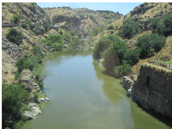
Tajo u Toleda

Z Aranjuezu jsme jeli zpět na západ do Toleda . Podobně jako u Ávily jsme nejdříve zastavili na několika místech na levém břehu Taja, odkud jsme měli nádherný pohled na město, ležící na pravém břehu vysoko nad tuto nejdelší španělskou řeku a obtékané jí postupně z východu, jihu a západu. Jedna ze zastávek byla ještě výše než město na druhém břehu.