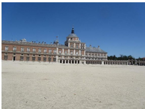
Aranjuez, královský palác

Hradby, postavené mezi 11. a 14. stoletím, jsou skutečně pro Ávilu charakteristické, jde o nejlépe zachované hradby ve Španělsku, jsou dlouhé 2,5 km a ohraničují plochu 31 ha, mají 2500 cimbuří, výšku průměrně 12 m a tloušťku 3 m, je v nich 9 bran a 88 hranolových nebo půlkruhových věží. Je to největší úplně osvětlovaná památka na světě.