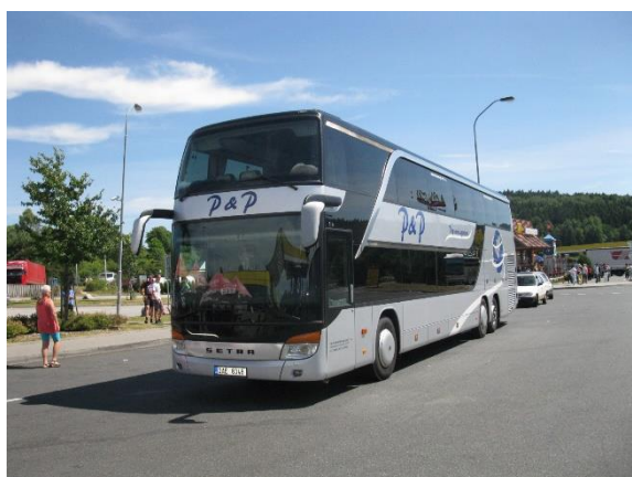
Autobus, jímž jsme jeli do Malgratu

Při organizaci těchto zájezdů je sobota zřejmě odpočinkový den. V sobotu ráno jsme do Malgratu přijeli, další sobotu na sklonku odpoledne odtud odjeli. Naším útočištěm byl hotel Reymar na hranicích se Sv. Zuzanou (Santa Susanna). Samo městečko Malgrat není nezajímavé, ale je nevelké a kvůli hospodaření se silami jsme se na blízké kopce nevydali, a tak jsme jen chodili vyhřátým městem, zašli na kávu, podívali se na nádraží (je tam lokální elektrifikovaná přímořská železnice), prošli se po pláži, navštívili některé obchody, druhou sobotu před odjezdem zašli do sousední Svaté Zuzany do supermarketu pro láhev vína, a také jsme užívali příjemné posezení v hotelovém interiéru i exteriéru, který nabízel i pěkný, čistý bazén.