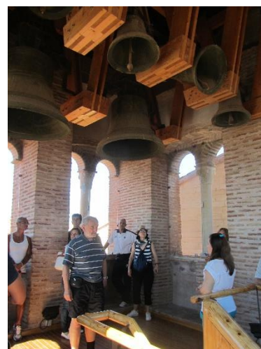
Ve věži u sv. Petra

Pro Teruel je charakteristický mudéjarský styl , promítající se do různých stavebních slohů zaváděním prvků arabské architektury, k němuž patří i poměrně časté užívání