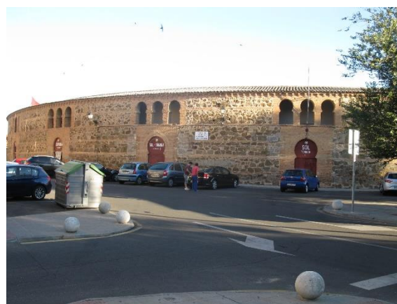
Býčí aréna v Toledu

Na rozdíl od Ávily jsme v Toledu měli skvěle situované ubytování v příjemném hotelu Maria Cristina s "nóbl" prostředím pro večeři i snídani. Hotel byl jen asi 0,5 km severně od brány v městském opevnění. V jeho těsném sousedství od severu byla býčí aréna, na niž jsme se rádi podívali, ovšem jen zvenku, a mezi hotelem a hradbami byl areál kolegia Sv. Jana Křtitele – kostel s klášterem a nepřístupnou zahradou. Mně se nejbližší okolí hotelu tak líbilo, že jsem si je ještě před čtvrtěční snídaní prošel.