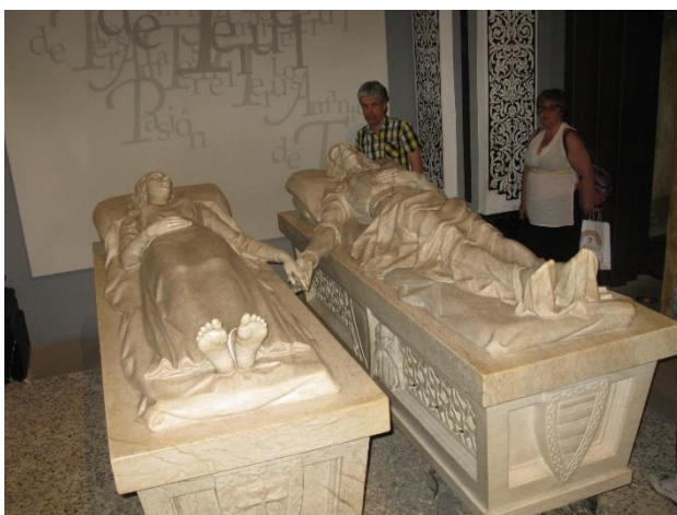
Hrob Diega a Isabely