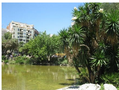
Park u baziliky S.F.