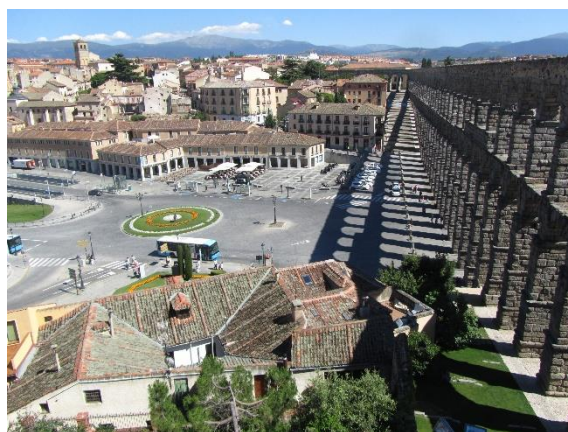
Segovia, akvadukt z akvaduktu