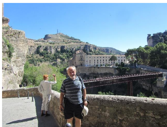
Most přes hluboké údolí pod historickou Cuenkou