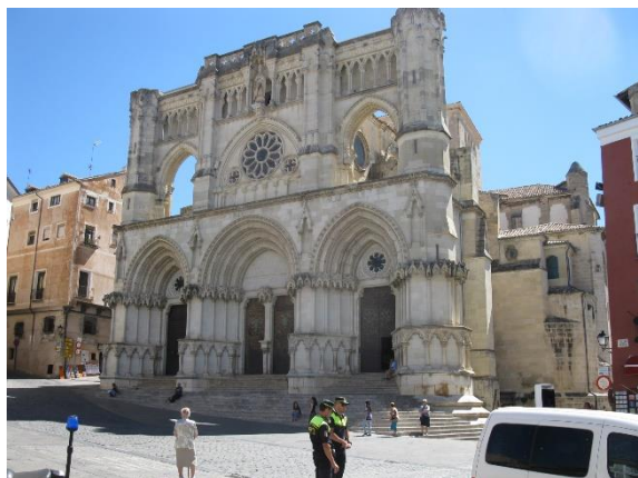
Katedrála v Cuenca

dolním konci branou a na ni navazující cesta vzhůru několik set metrů za druhý konec náměstí, odkud jsme měli krásnou vyhlídku na bezprostřední okolí města. Ve městě jsme navštívili obchod se suvenýry, myslím, že jsme tam koupili vnoučatům nějaké píšťalky, ovšem základním sortimentem byly upomínkové talíře.