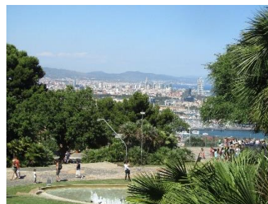
← Cestou z Montjuiku a pohledy odtud →