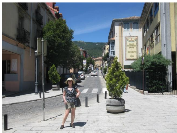
El Escorial - město

Na večeri a nocleh jsme se vrátili do hotelu ve Fuenlabradě a v úterý ráno jsme vyrazili na severozápad k druhému španělskému královskému sídlu, do El Escorialu . Nejdůležitějším a nejvýraznějším objektem v tomto asi 18tisícovém městě je královský palác, avšak je to žijící a funkční město. V "podzámčí" jsme se před odjezdem jen rozhlédli, byli jsme tam proto, abychom si prohlédli palác i s přilehlými zahradami. Pro centrální Španělsko jsou charakteristické velké nadmořské výšky; zde jsme byli asi 1030 m n.m. Při prohlídce paláce nás zaujala knihovna, kde byly knihy uloženy hřbety dozadu, čímž se údajně řešily problémy s vlhkostí vzduchu. Aby knihovna byla k něčemu, musela být speciálně řešena evidence knih, když nebyly dostupné nápisy na hřbetech. Viděli jsme řadu svědectví o zbožnosti španělských králů, např. stavební úpravu umožňující nemocnému králi sledovat mši. Úplně neuvěřitelné bylo, jak jeden nemocný král se nechal odnést do El Escorialu – výkon to byl nejen pro nosiče, ale i pro nemocného panovníka.