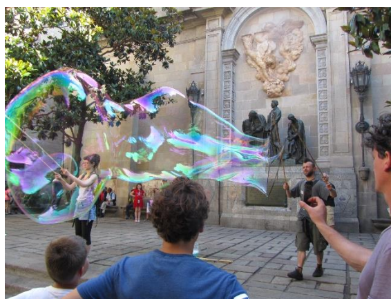
Bubliny u katedrály