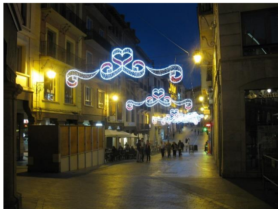
Večerní slavnostní Teruel

V pátek ráno jsme pak vyrazili do Barcelony. Překvapilo mě, že jsme vyjeli k jihovýchodu. Bylo to výhodné z hlediska úrovně silnic. A tak cestou do Katalánska jsme se na chvíli dostali jižně od 40. rovnoběžky, kdy jsme se přiblížili k Saguntu u Valencie; odtud jsme pokračovali už na severovýchod až do Barcelony. Podobně jako mezi Zaragozou a Alcalá jsme i tady projížděli až mrtvou krajinou. Různě zbarvené holé kopce skýtala sice zajímavý pohled, ale nějaký pozitivněji znějící přívlastek jí dát nelze.