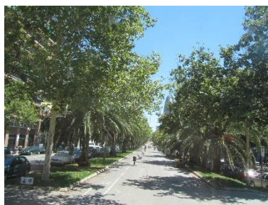
Rambla v okolí S.F.