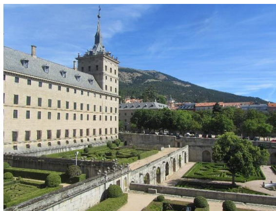
El Escorial - královský palác

Zvláštním svědectvím o španělské katolické zbožnosti byla návštěva krypty, která zabrala snad 30 % doby prohlídky zájmu, možná i více. Umístování rakví panovníků se tak jevilo jako záležitost nad jiné důležitá. Aspoň pro našeho tamního průvodce byla. Problémem byl panovník zesnulý za Frankovy diktatury, a tedy ve skutečnosti nekralující. V hlavní kryptě zbývalo snad jedno místo. Pro koho bude? Řešení si už nepamatuji, ale šlo o záležitost nesmírně závažnou. – Prostor pro zesulé, tedy pro ukládání rakví, byl členěný, bylo tam i "oddělení" pro dětské rakve. – Čas strávený v kryptě jsme svým způsobem vnímali jako tak trochu ztracený, prohlížet někde obrazy by bylo bývalo zajímavější, nicméně jsme v podzemním chládku mohli poněkud nahlédnout do španělského způsobu myšlení, který v této oblasti na hranici života a smrti je o hodně jiný než náš. A tak to stálo za to.