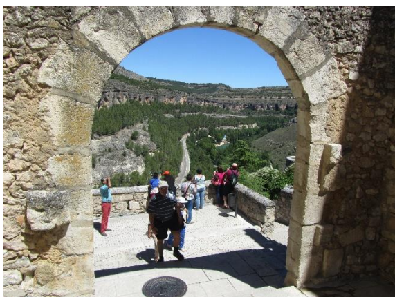
Z procházky na horní konec města