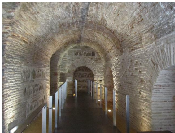
V podzemí El Grekova muzea

Na rozdíl od Ávily jsme v Toledu měli skvěle situované ubytování v příjemném hotelu Maria Cristina s "nóbl" prostředím pro večeři i snídani. Hotel byl jen asi 0,5 km severně od brány v městském opevnění. V jeho těsném sousedství od severu byla býčí aréna, na niž jsme se rádi podívali, ovšem jen zvenku, a mezi hotelem a hradbami byl areál kolegia Sv. Jana Křtitele – kostel s klášterem a nepřístupnou zahradou. Mně se nejbližší okolí hotelu tak líbilo, že jsem si je ještě před čtvrtěční snídaní prošel.