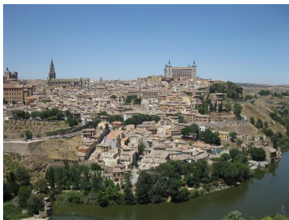
Pohled na Toledo přes Tajo

Když jsme se pohledu nabažili, zavezl nás autobus k městské bráně na severu a měli jsme možnost si toto bývalé hlavní město slavného španělského království