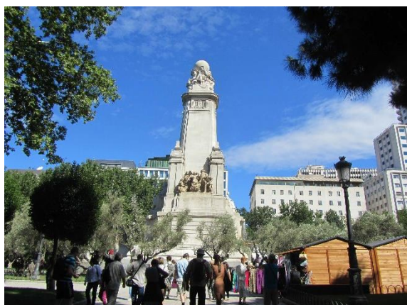
Cervantesův pomník u Královského paláce