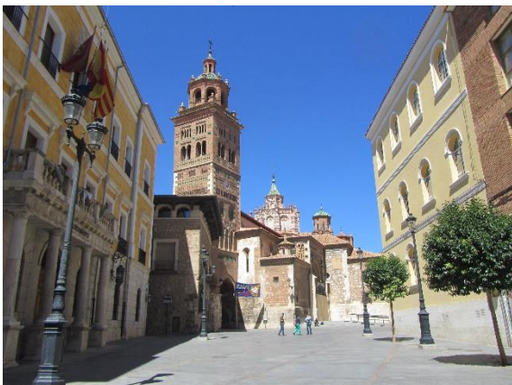
Věž v mudéjarském stylu

Procházka Teruelem, z větší části individuální, byla zajímavá a příjemná. Sešli jsme se zas u nádraží, kde na nás čekal autobus a vezl nás poměrně dlouho dobu do hotelu, kde jsme se ubytovali a dostali pokyny, kam máme jít na večeři. Pohled z hotelového okna korespondoval s představou, že jsme kdesi daleko za městem, jenže když jsme podle pokynů vyrazili na večeři, zanedlouho jsme došli k pěšímu i silničnímu mostu, které jsme po příjezdu viděli zdola a kousek směrem k širokému městskému schodišti byla restaurace, v níž byla pro nás přichystána večeře. Mezi restaurací a hotelem byla býčí aréna, v níž se cosi konalo. Večer jsme se ještě prošli ozdobeným a ochrannými provizorními protibýčími ploty vybaveným městem.