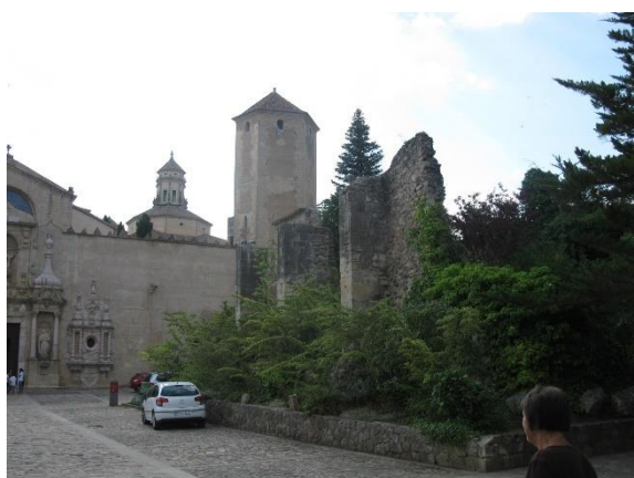
Rozmanitost kláštera v Pobletu

kolem Barcelony do cisterciáckého kláštera Poblet , který sice není tak známý jako Montserrat, nicméně je kulturně historicky cenný a bohatý; lze se v něm setkat i s ruinami, ale jako celek je funkční a lze se v něm setkat i se zajímavou florou. Po prohlídce Pobletu následoval dlouhý přejezd do Alcalá de Henares. Cesta vedla údolím Ebra; mezi Lleídou a Zaragozou jsme přijeli na západní polokouli a u Zaragozy jsme Ebro opustili a málo zalidněnou a málo zelenou krajinou jsme stoupali směrem ke španělské metropoli. Alcalá leží necelých 100 km před Madridem ve výšce téměř 600 m n.m.