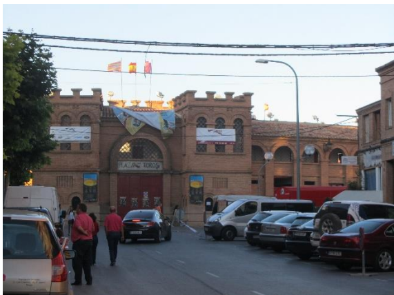
Býčí arána v Teruelu