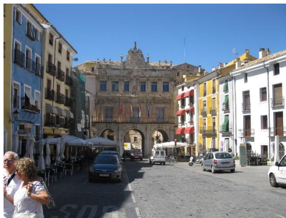
Brána na dolním konci náměstí