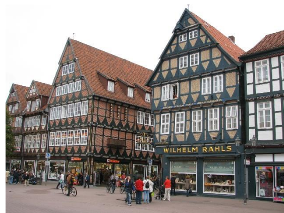
Celle, hrázděná architektura v centru města