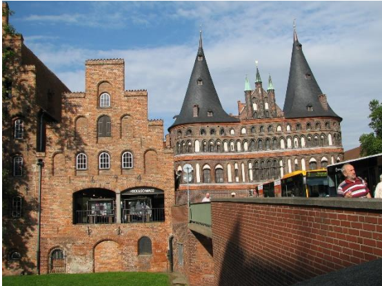
Lübeck, Holstentor (západní brána)

navštívili starý špitál, námořnickou hospodu, prošli jsme různými zajímavými ulicemi a uličkami. Zůstaly nám příjemné dojmy.