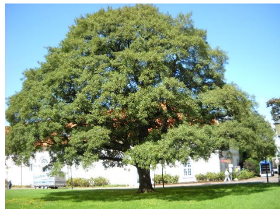
V Eutinu se lze setkat s různými přírodními krásami

dalšími dvěma cíli našeho zájezdu, městy Helsingør a Roskilde.