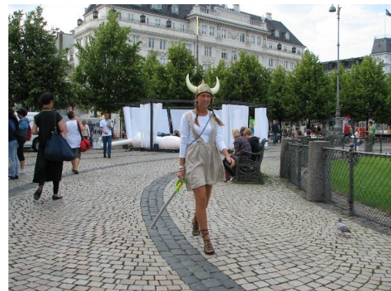
V centru Kodaňe