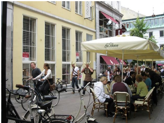
Ulice v Kodani

V Kodani jako v hlavním městě království je vídat pomníky králů. Z neurozených kruhů je tam asi nejčastěji připomínán spisovatel H. Ch. Andersen (1808-1875) a hned po něm přijdou fyzikové Niels Bohr (1885-1962) a Hans Christian Ørsted (1777-1851, není-li k dispozici písmeno Ø, píše se Oersted ), podle něhož se jmenuje i park v centru Kodaně.