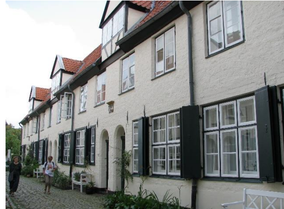
Lübeck, z procházky městem