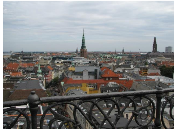
Pohled z Kulaté věže na Kodaň