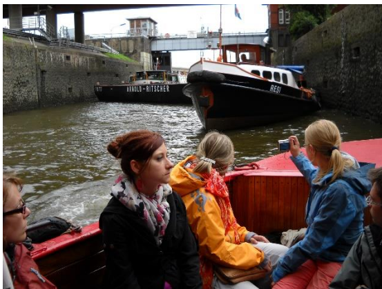
Hamburk, projížďka přístavem