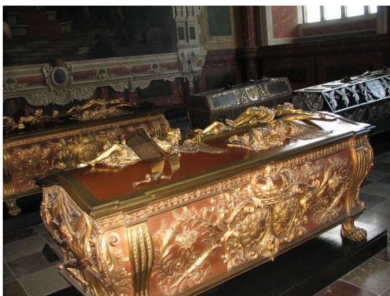
Královské rakve v katedrále

Podobně jako při čtvrtěčném příjezdu do oblasti Kodaně, tak i při sobotním odjezdu se hodilo, že jsme byli na západním předměstí, takže aniž bychom jeli do centra jsme mohli zamířit k dalšímu navštívenému místu – do 50tisícového univerzitního města a někdejšího sídla dánských králů Roskilde , kde v katedrále jsou králové pohřbíváni.