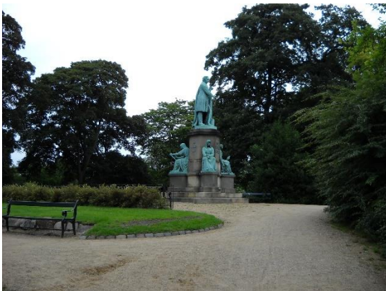
V Ørstedově parku je mohutný pomník věnovaný tomuto významnému dánskému průkopníku teorie elektromagnetismu