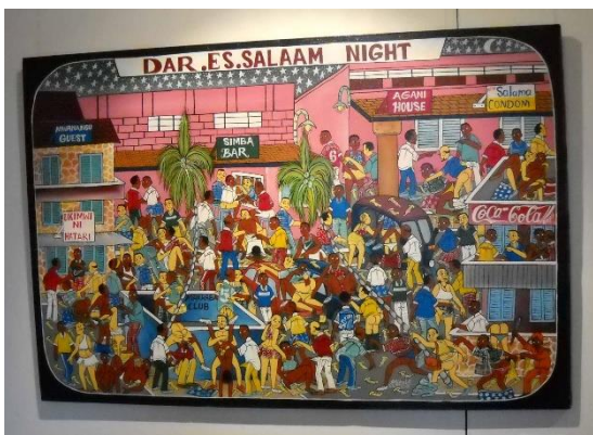
Výstava v Kulaté věži

restaurací atd. Především však se za oněch 19 roků ulice naplnily lidmi a zatímco tehdy jsem vídal téměř výhradně bělochy, dnes je Kodaň rasově pestrá jako metropole v menších zeměpisných šířkách. S jízdním kolem jako hojně využívaným dopravním prostředkem jsem se setkal už tehdy a tuto roli si ponechává. Míchání kultur se projevilo i v kavárenské praxi. Unaven chozením po Kodani jsem se moc těšil na kávu. Nenapadlo mě, že i tam už difundoval jižní zvyk sice velmi chutných a kvalitních, avšak téměř bezvodých espress, servírovaných v jakýchsi "náprstcích". V přelidněné kavárně (s posezením na uliční zahrádce) jsme si nejdříve zaplatili a pak zboží vyzvedli. Evi si objednala nějaké latté či kapučíno a díky tomu dostala normální porci, avšak mne čekal ten malinký náprsteček. Jak jsem byl unavený a těšil jsem se na osvěžení kávou, tak to byl pro mne šok; na chvíli jsem docela klesla na mysl.