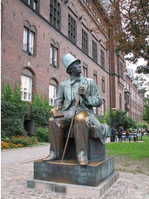
Pomník H. Ch. Andersena

Když byla Nielsu Bohrovi r. 1922 udělena Nobelova cena, byl ve vlasti celkem neznámý, a tak tisk jeho osobnost přibližoval tím, že psali, že Nobelovu cenu za fyziku dostává bratr dánského fotbalového reprezentanta Haralda Bohra. Harald byl ovšem nejen fotbalistou, nýbrž i špičkovým matematikem. R. 1975 získal Nobelovu cenu za fyziku Nielsův syn Aage (1922-2009).