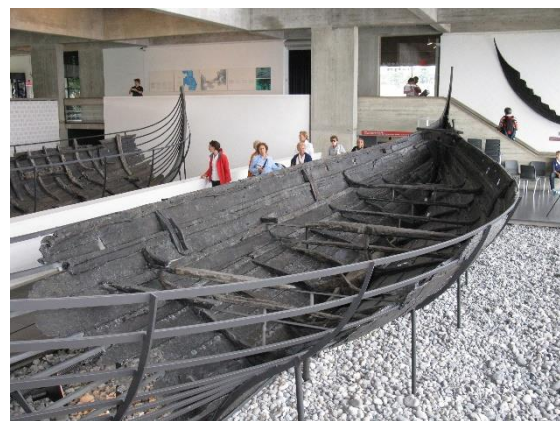
Muzeum vikinských lodí

Zajímavostí v roskildecké katedrále je sloup, na němž je vyznačena výška králů, kteří ji navštívili. Dalším naším zastavením v Roskilde bylo muzeum vikinských lodí . Exponáty byly jak pod střechou, tak venku, a zpravidla byly u nich uváděny (v angličtině) rozměry a další kvantitativní charakteristiky jako ponor, nosnost, ale také počet členů posádky (např. délka 14 m, šířka 3,3 m, ponor 0,9 m, výtlač 9,6 tun, nosnost zboží 4,6