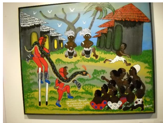
Výstava v Kulaté věži