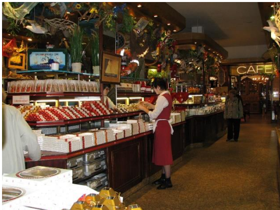
Lübeck, muzeum marcipánu