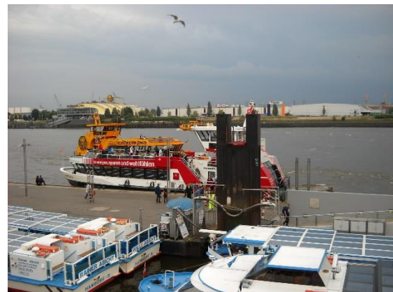
Hamburk, projížďka přístavem

V Lübecku nás při vstupu do města přivítala krásná Holstenská brána, ležící u Mostu panenek (Puppenbrücke) přes západní rameno Trávy (řeka Trave) – staré město je na ostrově, přičemž ramena řeky jsou součástí opevnění. Lübeck je velice hezkým historickým městem, v němž panuje (či aspoň tehdy panoval) čilý turistický ruch se vším, co k němu patří – tržička, pouliční hudebníci apod. Zvláštní atrakcí je muzeum marcipánu, v němž jsme si dali svou oblíbenou kávu. Při společné prohlídce jsme