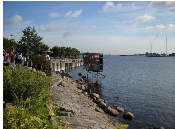
Malá mořská víla byla na dovolené

Podle plánu jsme měli páteční program začít v Helsingøru. Pozdní otvírací doba zámku Kronborg však paní průvodkyni vedla k tomu, že jsme se cestou zastavili na severovýchodě Kodaně a tam navštívili místo, kde bývá "ikona Kodaně" Malá mořská víla ( Den lille Havfrue , doslova Malá mořská dáma ), avšak byla tam jen informace, že soška je zapůjčena kamsi na výstavu). Prošli jsme si příjemné okolí onoho místa s citadelou (Kastellet) a několika kostely a odjeli na sever Sjællandu do Helsingøru a tam absolvovali prohlídku Hamletova Kronborgu, a to jak jeho interiéru s tajuplným podzemím, tak i jeho exteriéru s četnými kanóny. A měli jsme odtud i výhled na švédský Helsingborg – byl to asi náš poslední pohled do Švédska.