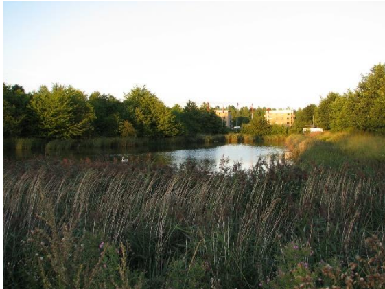
Ballerup, v pozadí hotel ZZZleep

V Dánsku jsme dojeli do Ballerupu , což je západní předměstí Kodaně, a tam jsme se na dvě noci ubytovali v jednoduchém hotelu s podivným názvem ZZZleep, z nějž si pamatuji především nefunkční okna v pokoji – větrat šlo, ale nějaké problémy s tím byly. Okolí hotelu bylo docela příjemné, nedaleko byla stanice S-Bahn, kterou jsme ovšem nevyužili.