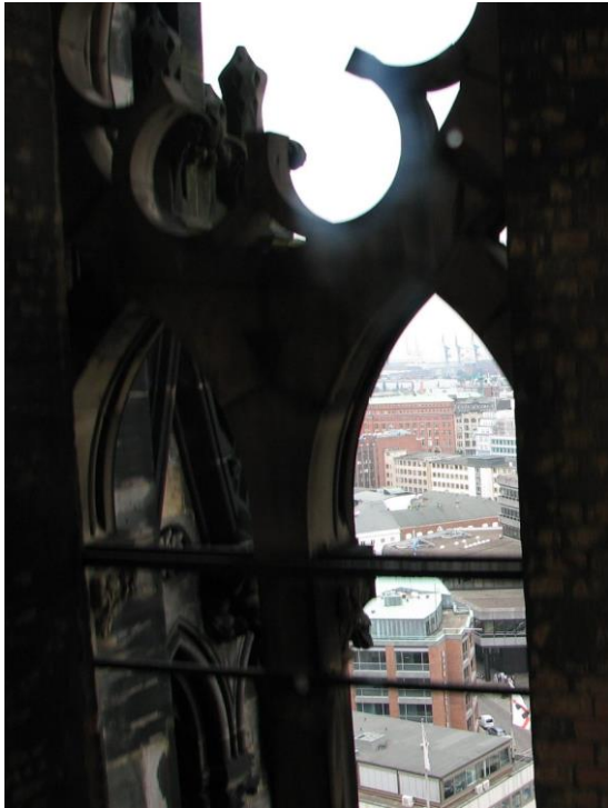
Hamburk, kostel sv. Mikuláše

příjemném nočním odpočinku následovala cesta dále na severovýchod do asi 50 km vzdáleného schleswicko-holštýnského historického města Lübecku.