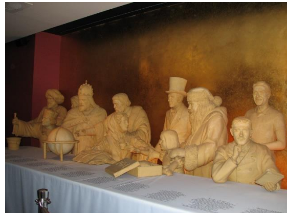
Lübeck, muzeum marcipánu

Kolem 13. hodiny jsme odjeli do Eutinu . Je to hezké město s krásným parkem, v němž je příjemně působící vodní nádrž. Hlavním posláním této zastávky ovšem nebyly krásy tohoto města na severovýchodě Schleswicka-Holštýnska, nýbrž obchody, umožňující nákup za eura a v přijatelnějších německých cenách. Paní průvodkyně nás upozorňovala, že v Dánsku je výrazně dražší. Využili jsme jak obchody, tak kouzlo města a spokojeně pokračovali autobusem do Puttgarden, kde nás i s autobusem naložili na trajekt do dánského Rødby na ostrově Lolland, odkud už bylo možno pokračovat po silnici na hlavní dánský ostrov Sjælland s metropolí Kodaní a