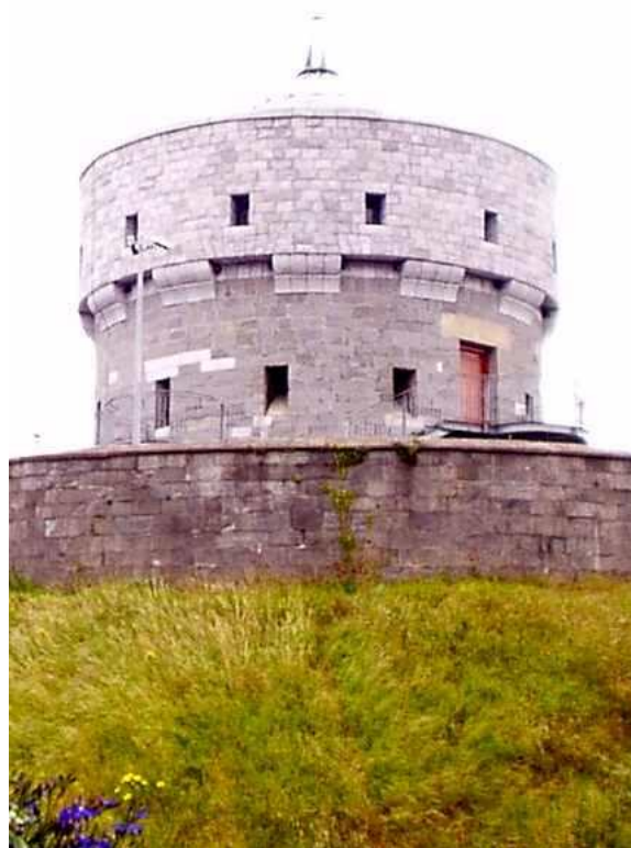
Středověký větrný mlýn v Droghedě